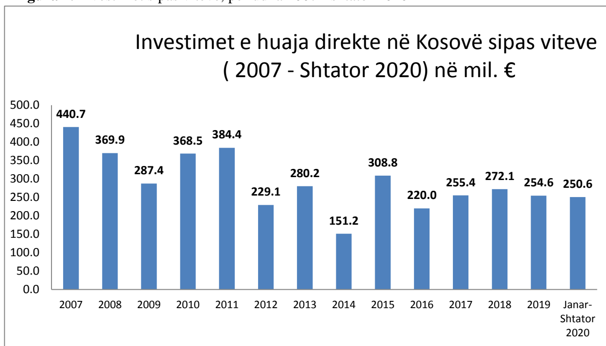
Figura 2. Investimet sipas viteve, periudha 2007 - shtator 2020

Agjencia për Investime dhe Përkrahje të Ndërmarrjeve, sa i përket të dhënave për Investimet e Huaja Direkte në Kosovë bazohet në raportet e Bankës Qendrore të Kosovës (BQK), të cilat publikohen në faza periodike.